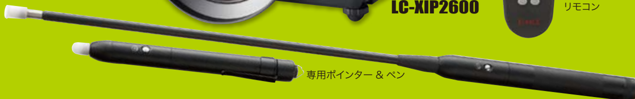
専用ポインター & ペン